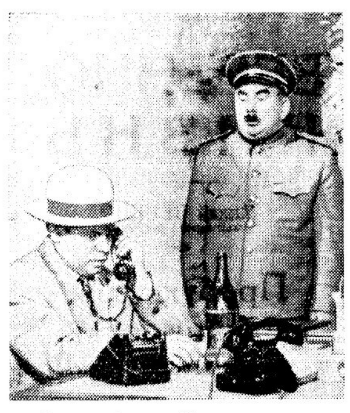
Кадр из фильма «Мы с вами где-то встречались»

Во всех этих эпизодах затрещал живой нерв комедии, появилась правда жизни, идея, смысл и, конечно, настоящий, умный смех. Кажется бы, тыщете эту линию дальше, смело ставьте Максимова-Райкина в новые комические положения, используйте все возможности кинематографа, ведь зритель же поверил вам, пришло вам время как жизненно ситуации. Но то ли у сценариста не хватало богатства выдумки, то ли авторы фильма вдруг перестали доверять возможностям Аркадия Райкина, как артиста кино (а возможности у него при его пластике, речевой выразительности, не говоря уже об изумительной способности к трансформации, — богатейшие), но сюжет вдруг застопорился и буксует на месте. На экране появляется эстрадный театр — с декорациями, со всей сценической условностью, и А. Райкин начинает исполнять свои эстрадные миниатюры, причем далеко не самые удачные.